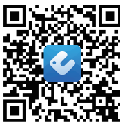
EWPE Smart letöltő QR kód

Szkennelje be a QR kódot, vagy töltsse le az "EWPE Smart" applikációt az áruházból, és telepítse fel az okostelefonjára. Miután telepítette az alkalmazást, hozzon létre egy új fiókot, és párosítsa az otthoni okos berendezést az alkalmazással, ezután internet elérés mellett távolról is irányíthatja okos eszközét a mobiltelefon segítségével. Bővebb információkért kattintson a "Segítség" gombra az alkalmazáson belül, vagy keresse fel a www.syen.hu oldalt.